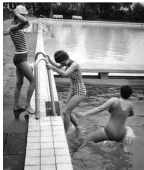
Anbaden im Sommer

A uch jenseits des Beckens veränderte sich die Welt: Die Flussbäder an der Weser litten unter zunehmender Wasserverschmutzung. 1955 wurde die Wagenbrettsche Badeanstalt geschlossen, das Holzgebäude auf einen LKW verladen und abtransportiert. Ihr Gelände ging an die Gesellschaft für öffentliche Bäder über – es wurde dem Stadionbad zugeschlagen, die Liegeflächen wurden erweitert, um noch mehr Gästen Platz zu bieten.