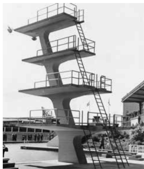
Erneuerter Sprungturm 1951, Urheber: Georg Schmidt – Die Bremer Tageszeitungen AG