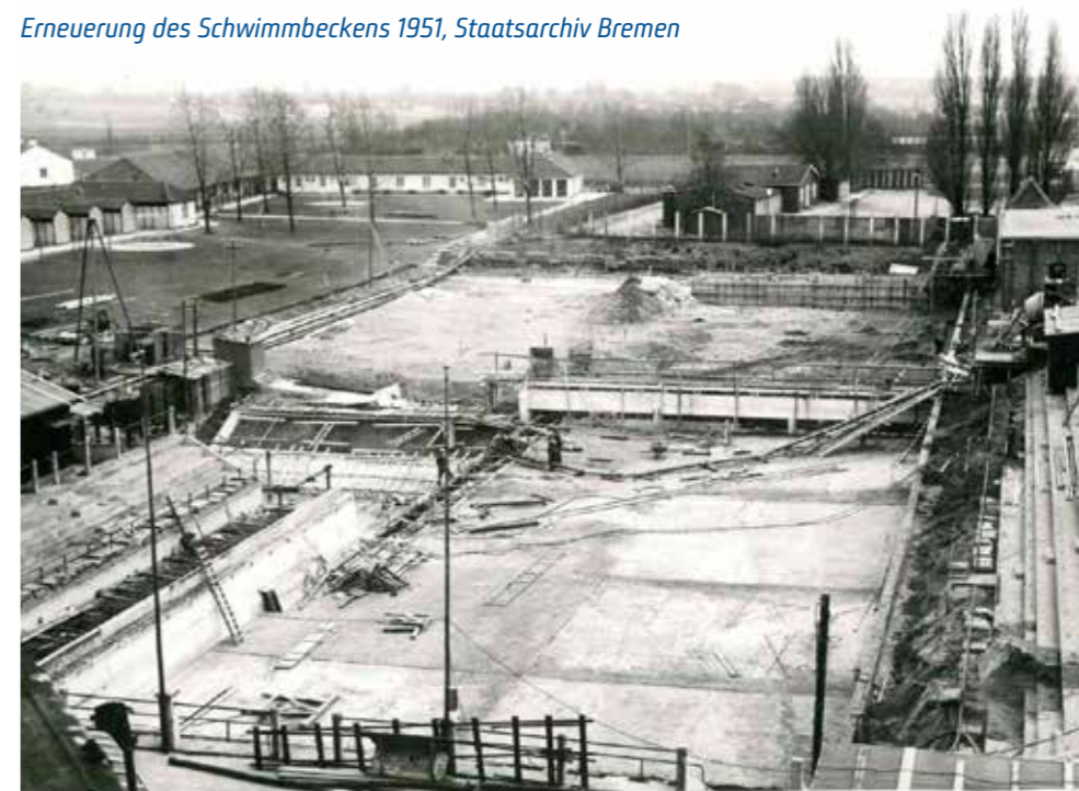
Erneuerung des Schwimmbeckens 1951

Becken floss. Die Lösung: eine hochmoderne Filteranlage, die das Wasser innerhalb von 18 Stunden komplett reinigen konnte. Die Sanitäranlagen wurden angepasst, die Sprunggrube verlegt, und ein neuer Sprungturm errichtet – mit 1-, 3-, 5-, 7½- und 10-Meter-Brettern, ganz nach den Vorgaben des Deutschen Schwimmverbandes. Senator Paulmann genehmigte die Erweiterung, und laut Bäder-Direktor Adolf Jung hatte das Stadionbad, das einst „keinen Luxus“ bot, nun ein modernes Gesicht.