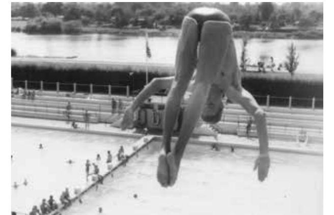
Turmsprung, 80er Jahre

Während der klassische Rhythmus aus Frühjahrsreinigung, Saisoneroöffnung, wetterbedingten Besucherhochs oder -tiefs, Wettkämpfen und Schließung konstant blieb, ist das Stadionbad auch immer mit der Zeit gegangen. Die Bremer Bädergesellschaft etablierte neue Formate wie Freibadpartys, um neue Zielgruppen anzusprechen. Ein Beispiel dafür war die „Karibische Nacht“ am 6. Juli 1983, die mit Flutlichtschwimmen, Musik und einem Hypnotiseur ein vielfältiges