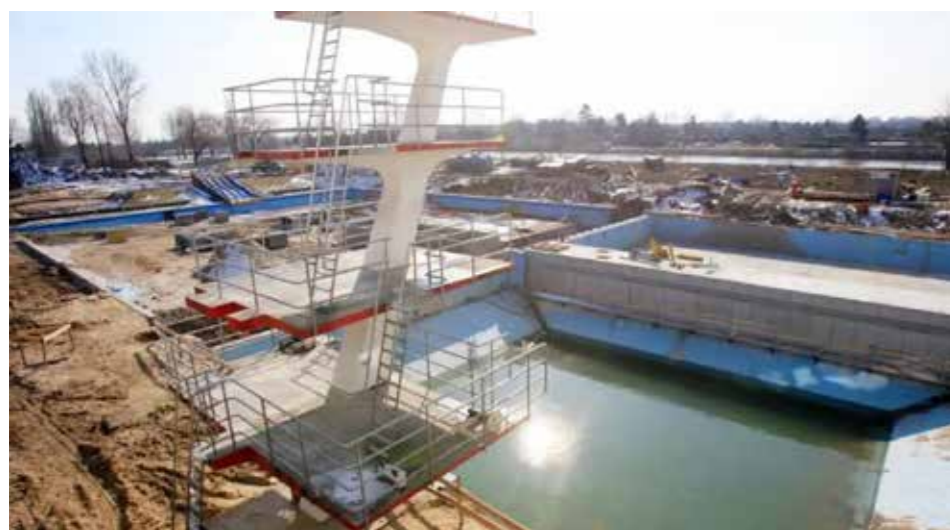
Umbau 2006

Parallel zu dieser Angebotsausweitung wurde der bauliche Zustand des Bades zunehmend problematisch. Im Zuge der Bauarbeiten am benachbarten Weserstadion wurden 1992 auch auf dem Gelände des Stadionbads Bauzäune aufgestellt. Badleiter Günter Maas konnte der Situation noch etwas Positives abgewinnen: Der neue Tribünenüberhang bot erstmals die Möglichkeit, Badekleidung bei Regen geschützt abzulegen.