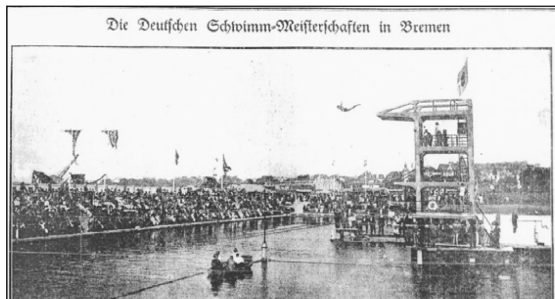
Deutsche Schwimmmeisterschaften, offizielle Eröffnung 08.08. 1925, Bremer Nachrichten