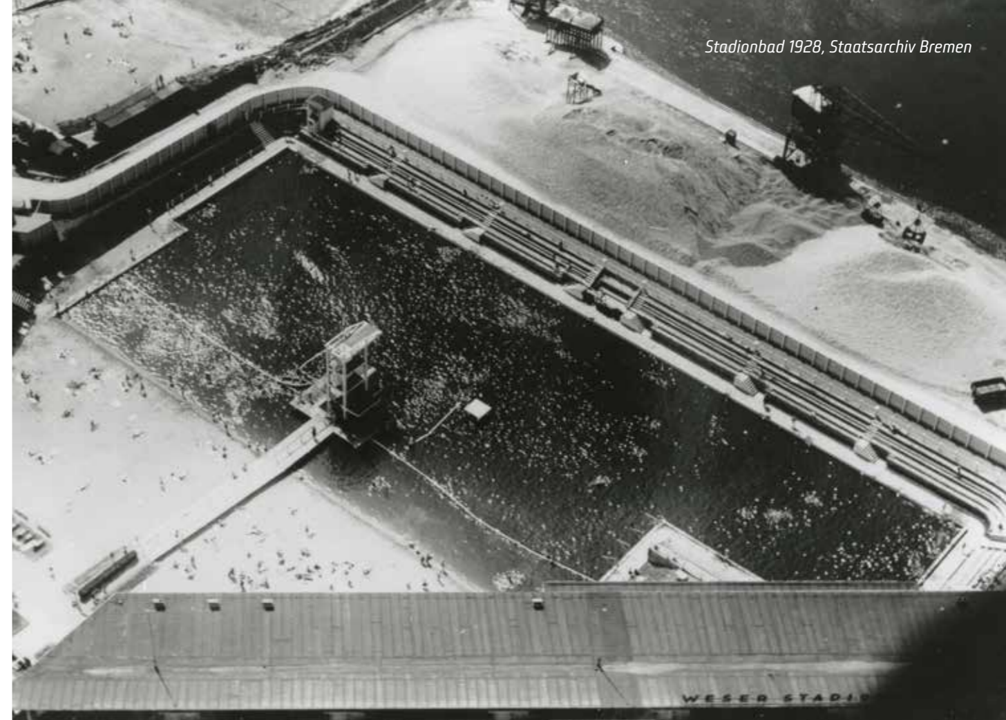
Stadionbad 1928