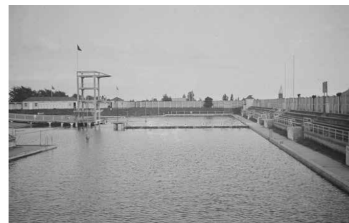
Stadionbad 1935