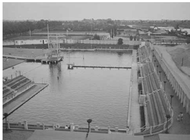
Stadionbad 1936

suchszeiten beschränkt, Eintrittskarten markiert und gesonderte Badebereiche zugewiesen. Später hieß es offen: „Juden ist der Zutritt verboten.“ Auch das Stadionbad war betroffen. Die politische Realität jener Jahre war bitter: Wo man sich einst gemeinsam im Wasser begegnete, wurde nun getrennt, ausgeschlossen, kontrolliert. Einige Betreiber setzten sich dagegen zur Wehr, allerdings mit begrenztem Spielraum. Das sich gleich nebenan befindliche Flussbad Wagenbrett machte von seinem Hausrecht Gebrauch und ließ Jüdinnen und Juden noch eine Zeit lang baden. Doch nach der Pogromnacht 1938 galt der Bann für alle Bade- und Schwimmbereiche.